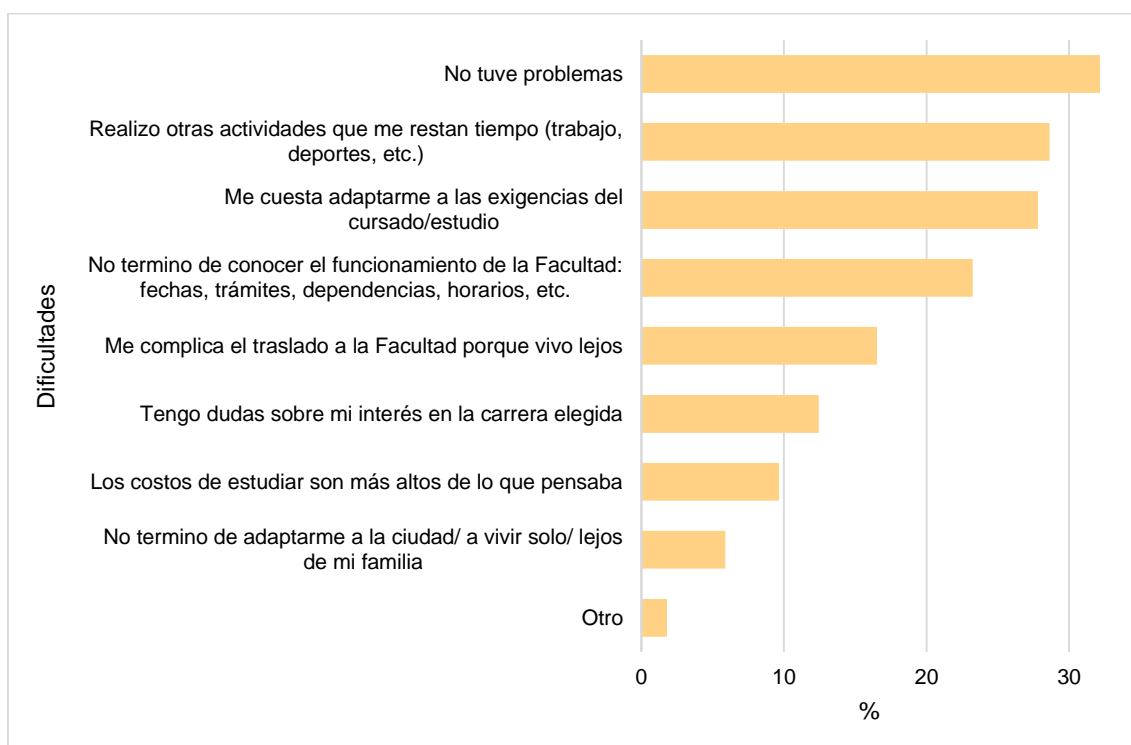
Figura 1. Dificultades en el ingreso

En cuanto a las dificultades encontradas en las materias que se cursan en el primer cuatrimestre los estudiantes del CIC en los siguientes cuadros se exponen las respuestas para cada una de ellas. Se realiza un análisis para cada materia exponiendo las dificultades presentadas por las/los encuestadas/os según si cursan la materia por primera vez, si es recursante, si no la cursó o si ya la aprobó. Esta mecánica se repite al momento de analizar cómo hizo para superar estas dificultades. Además, se exponen los contenidos en los que los estudiantes mencionan haber tenido dificultades.